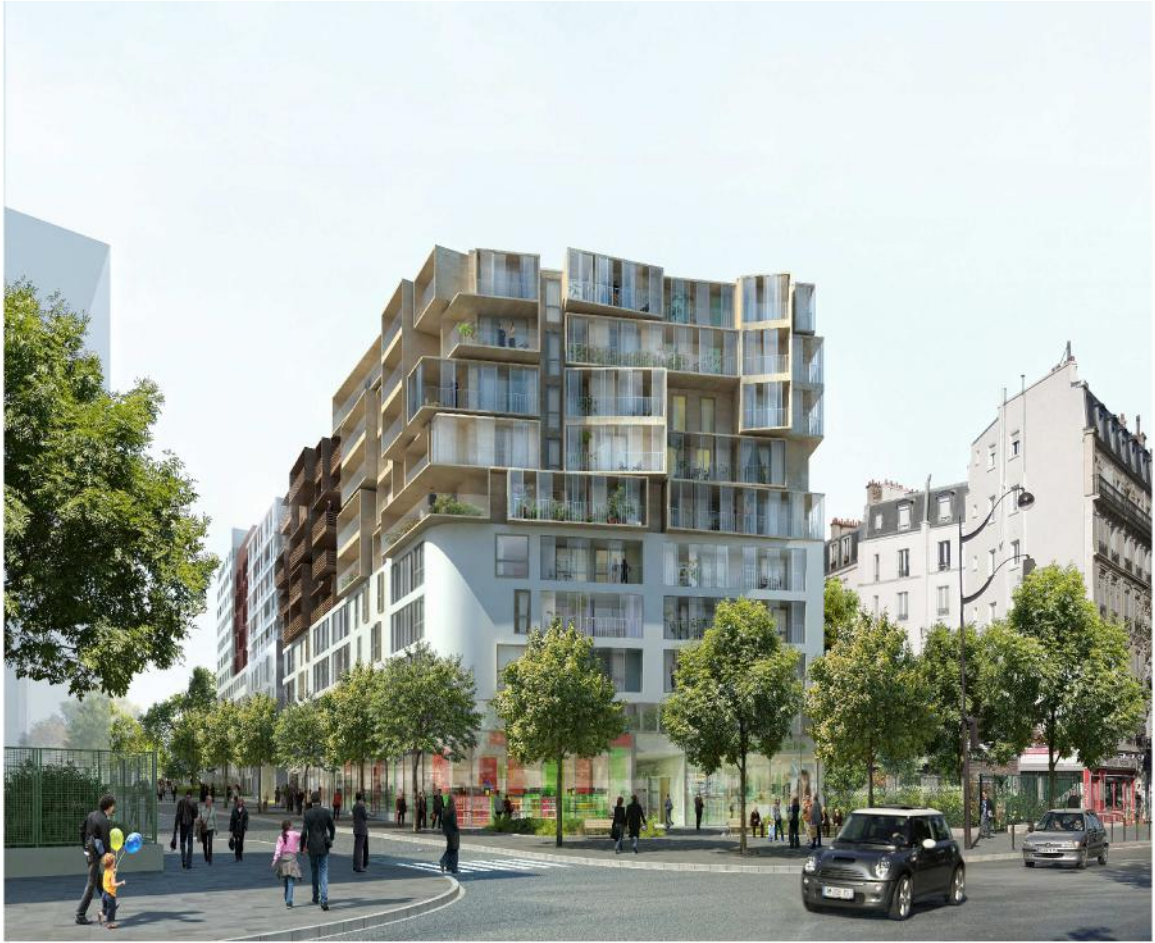
Vue de l'opération depuis l'avenue de Clichy (image du projet initial)