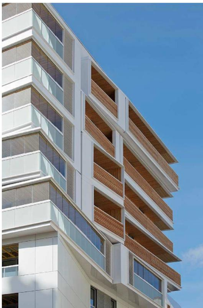
Emergences à partir du 5 ème niveau : loggias et boîtes-loggias

Un soin particulier a été porté à l'aménagement des espaces extérieurs du macro-lot qui repose sur une conception d'ensemble confiée à une unique équipe de paysagistes commune aux trois programmes. Le principe du jardin décline le thème du sillon en dessinant au sol des tracés parallèles et sinueux intercalant les surfaces plantées et les surfaces minérales. Outre le soin apporté au traitement des sols et des plantations, cet aménagement permet de dégager des perméabilités visuelles (porosités) sur le cœur d'îlot depuis l'espace public. En outre, il offre des espaces partagés entre les différents éléments du programme. Le jardin de cœur d'îlot, communiquant du RDC au 1 er étage, fédère ainsi l'ensemble des programmes du macro-lot.