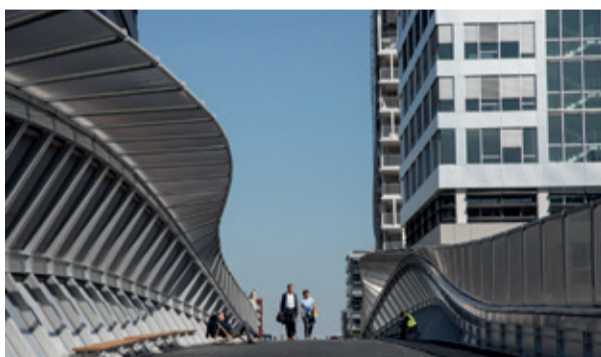
Passerelle de franchissement du faisceau ferré Saint-Lazare. © Eric Facon Signatures - Marc Mimram Architectes