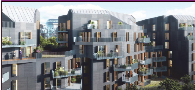
Vue des terrasses et des jardins suspendus depuis les immeubles en face, rue de Saussure